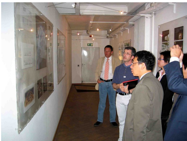
Projektvorstellung bei der Berliner „ideea“ – Messe- und Dekorationsbau GmbH, einem Kooperationspartner der Media Academy

Orientierungspunkt für das Shanghaier College sind dabei die beiden großen Ereignisse in China, die olympischen Spiele 2008 und die EXPO 2010, zu denen die chinesischen Veranstaltungsun-