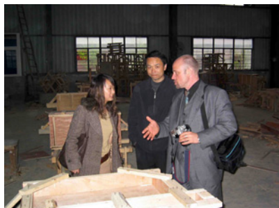
Besuch der Trainingswerkstatt: großer Modernisierungsbedarf in Methodik und Ausstattung...

Dass diese Aufgabe – mit allen guten Ansätzen und Aussichten – nicht „aus dem Stand“ zu meistern ist, sondern einen weiteren intensiven Austausch und vor allem die Erledigung etlicher „Hausaufgaben“ auf beiden Seiten erfordert ist für Strehle keine Frage. So befinden sich im Rückreisegepäck nicht nur viele neue Eindrücke und Informationen, sondern auch bereits eine lange Liste der nun abzuarbeitenden Aufgaben, damit das „Geschäftsfeld China“ nicht nur ein Luftschloss bleibt. Dazu gehört neben dem Training von geeignetem Ausbildungspersonal oder der Vorbereitung von notwendigen Schulungsunterlagen auch die Verstärkung der „Netzwerkarbeit“ vor allem mit