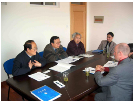
Prof. Cao: Beruflicher Ausbildung in China fehlt der Praxisbezug....

Dabei ginge es, so Yang, auch um die Schaffung von einheitlichen Standards für die Qualifizierung und Bauausführung, deren Fehlen die chinesische Bauwirtschaft vor allem im internationalen Wettbewerb behindere.